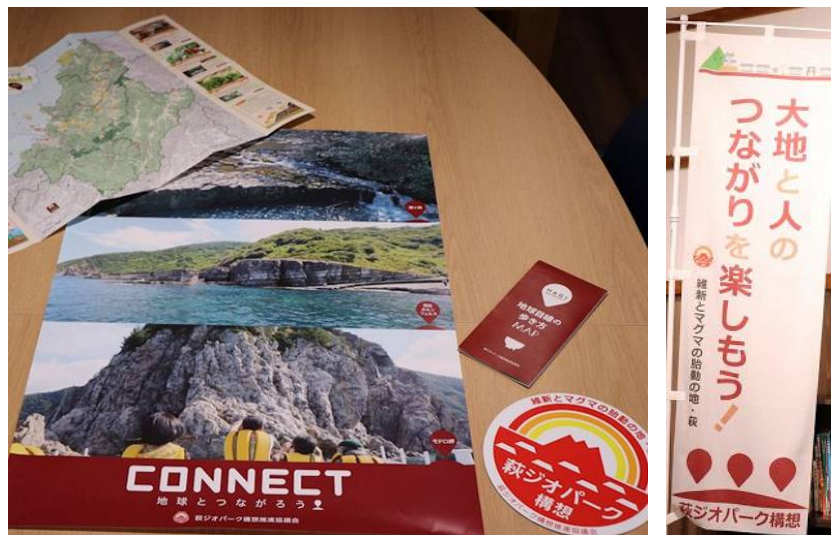
(マップ・マグネットシール・ポスター・のぼり)

最後は「CM」です。当協議会で、初のジオパーク紹介CMを作りました。これは、皆さんに地球科学を身近な視点で感じてもらう、そして楽しんでもらうという趣旨で作りました。最初は「なんだこれ？」と感じると思いますがリピートしたくなるCMです！ 渾身の作品、是非ご覧ください。[YouTubeにて「萩ジオパーク構想」で検索！！（萩ジオパーク構想推進協議会公式HPからもご覧いただけます）