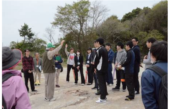
(熱心に説明に耳を傾ける新人職員たち)

4月17日に萩市役所の新規採用職員研修の一環で、ジオパークに関する研修がありました。その内容を企画し、当日の案内もしたのが、なんと萩ジオプランナーのみなさんです。萩城下町の散策をした後、城下町を支えた「石材」に目を向けて「大地と人のつながり」を実感してもらうツアーが始まりました。城と城下町で石材が異なるのはなんでだろう？ 石材はどこから来たのだろう？ 指月山や笠山の石切り場をめぐって、そのナゾを解いていきました。最後にはハンマーとタガネで石をたたいて岩石の性質の違いを肌で感じる体験もありました。