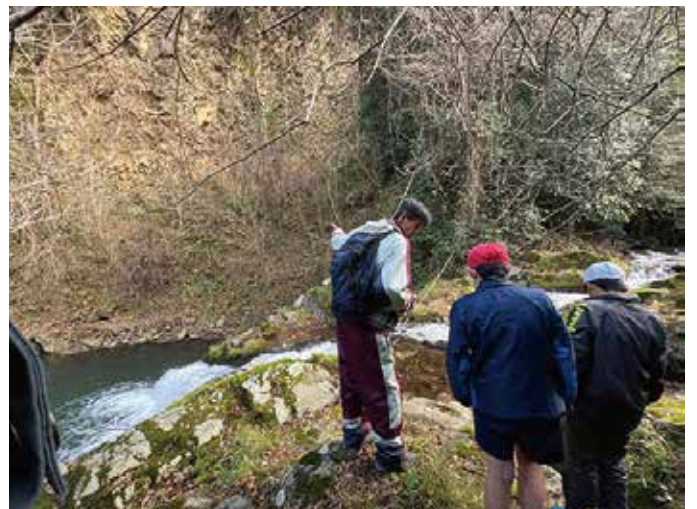
福栄小学校6年生 現地見学

また、福栄小中学校6年生では、11月28日、12月5日、12日の3週連続で授業を実施。地元の火山灰（伊良尾尾山）の観察や火山実験をしたり、自分たちが暮らす大地の成り立ちを確かめに現地見学をしたりしました。