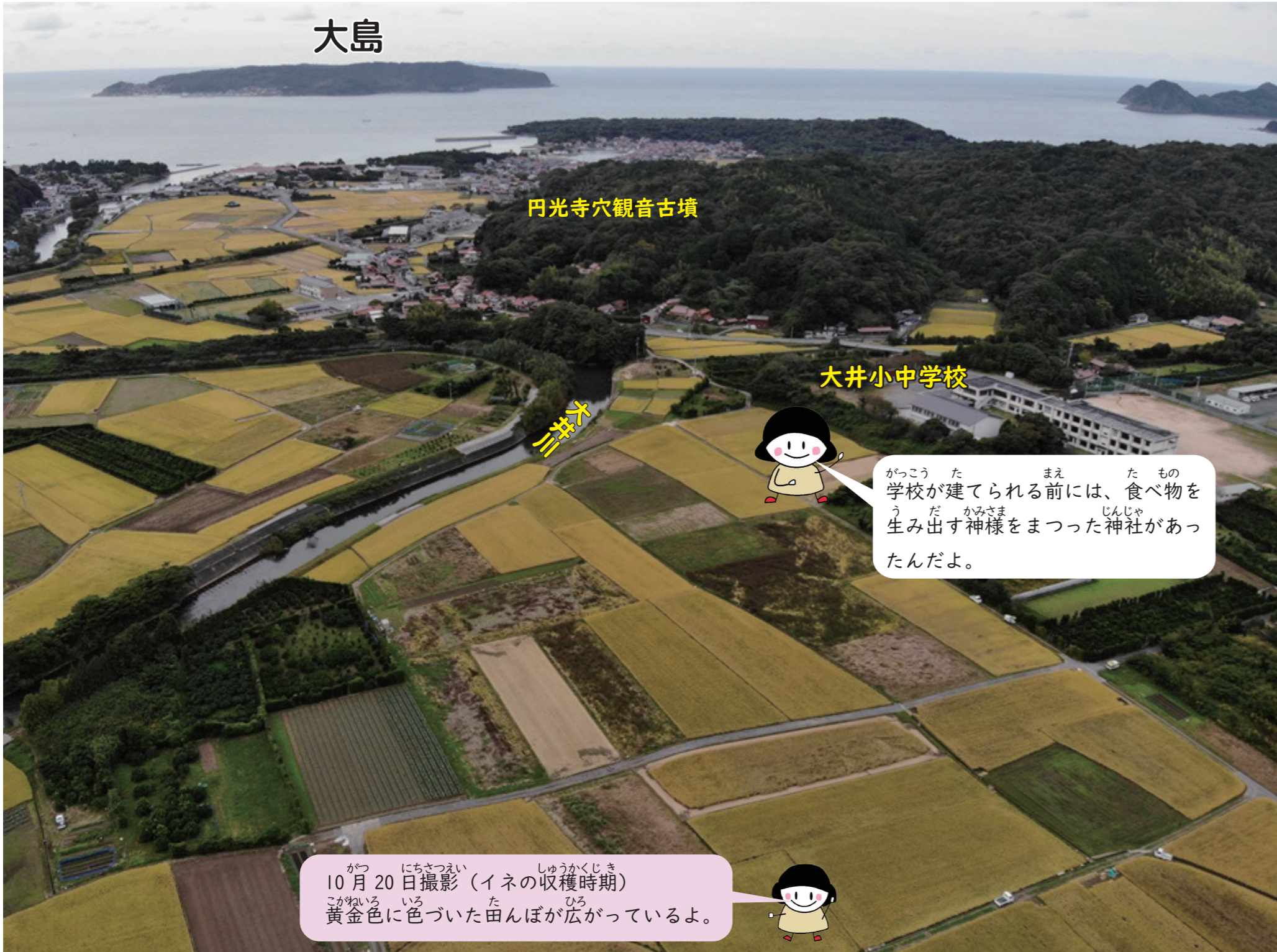
円光寺穴観音古墳