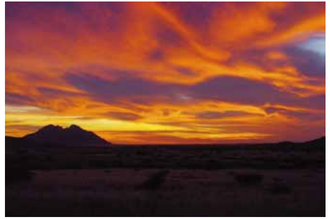
ナミビアの花崗岩地帯の夕焼け